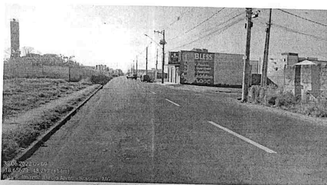
Figura 1 - Imóveis particulares sem calçada.