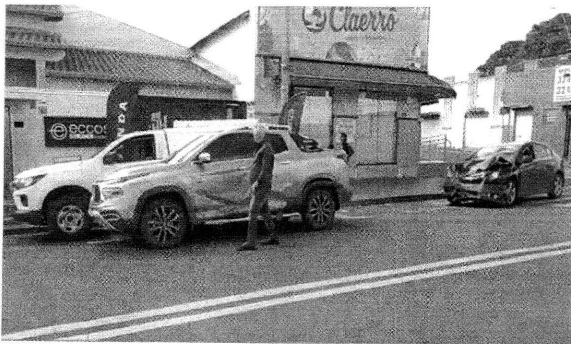
ANTIGOS ACIDENTES – NATAL MUJALI – PRAÇA FARID NADER