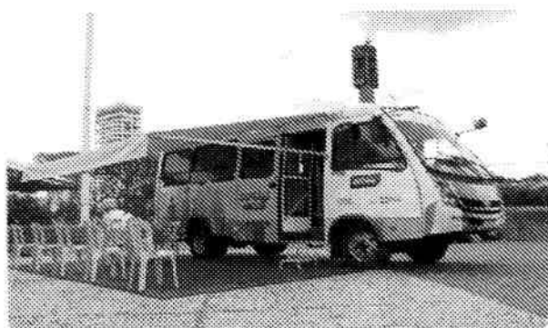
Busão Social