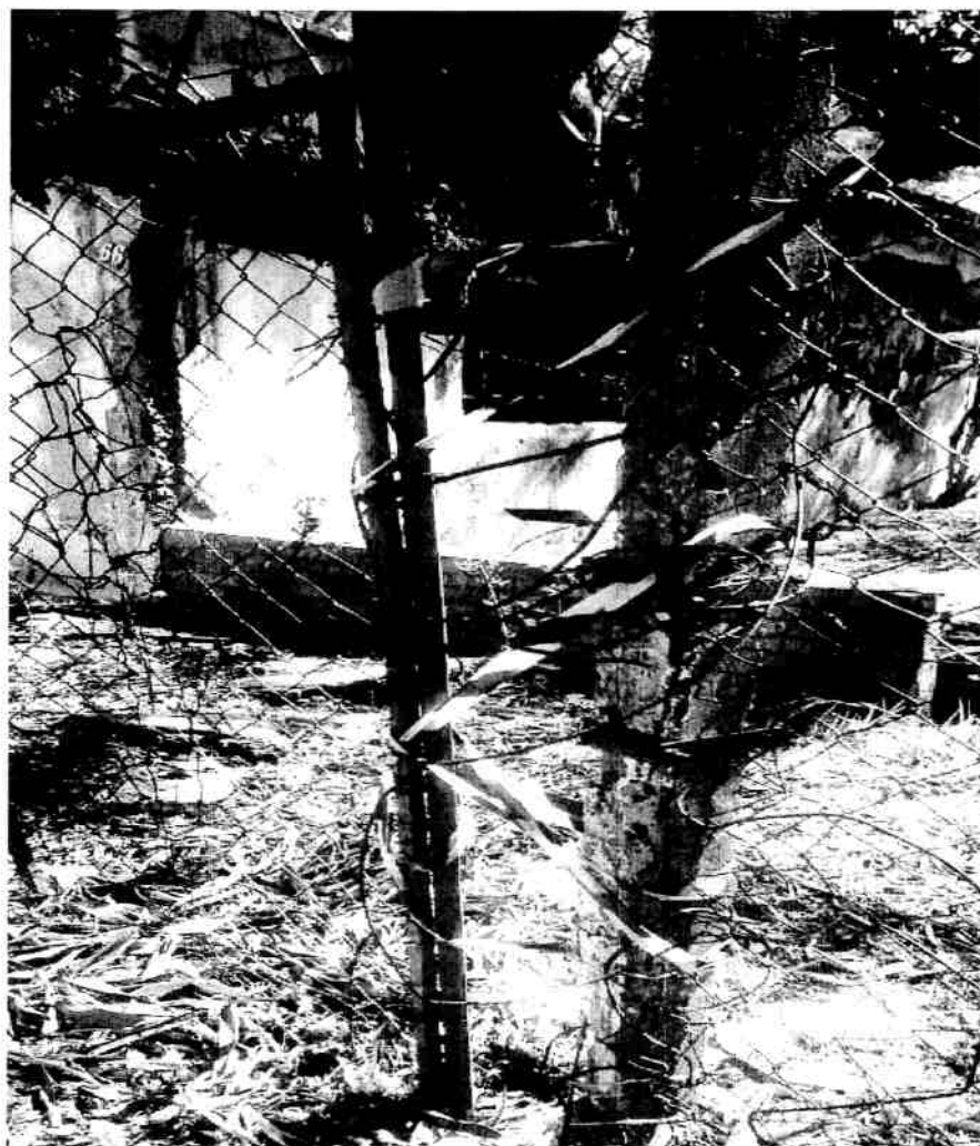
Foto 06: Fechamento com arames e fita zebraada para identificação.